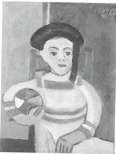
Czóbel Béla: Labdát tartó fiú, 1916. Czóbel Múzeum, Szentendre.