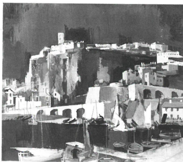
Aba-Novák Vilmos: Kikötő , 1930. Tempera, falemez MNG ltsz.: 68 65 T