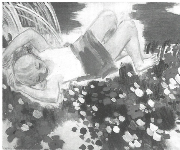
Vaszary János: Kislány virágok között, 1930-as évek magántulajdon