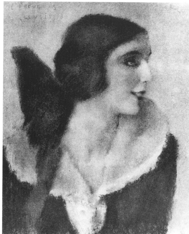
Rippl-Rónai József Darvas Lili-sorozata Molnár Ferenc az Égi és földi szerelem című drámájának amatőr kiadásában, Panteon, 1922, Budapest