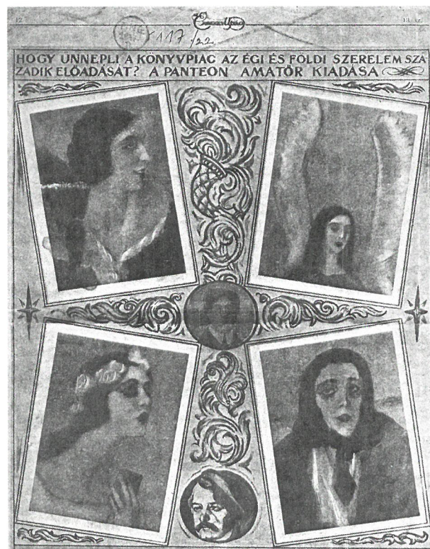
Az Érdekes Újság híradása az Égi és földi szerelem 500 példányos amatőri kiadásáról

Kikiáltási ár: 6 000 000 Ft / 24 490 EUR