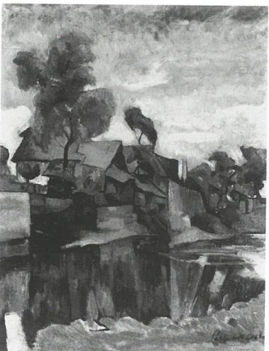
Perlrott Csaba Vilmos: Patakpart Nagybányán, 1923 körül, magántulajdon