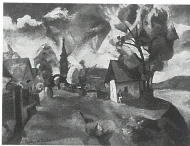
Perlrott Csaba Vilmos: Pócsmegyeri táj, 1922, magántulajdon