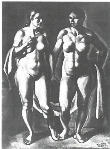
Kmetty János: Két álló női akt drapériával, olaj, vászon, 1918 körül Ferenczy Múzeum, Szentendre