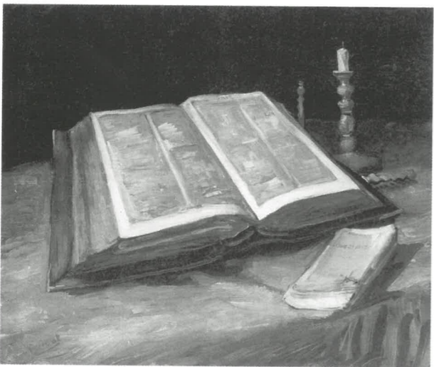
Vincent van Gogh: Csendélet Bibliával, 1885, Rijksmuseum, Amsterdam