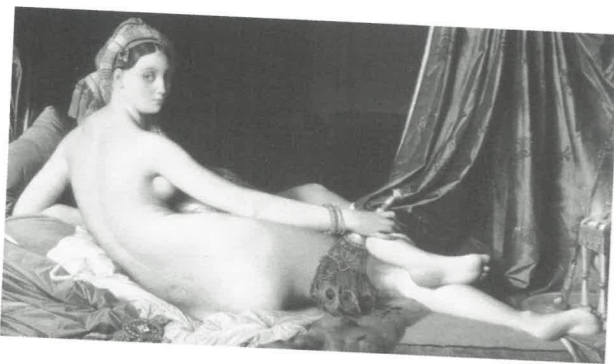
Jean Auguste Dominique Ingres: A „nagy” Odaliská, 1814, Louvre, Párizs