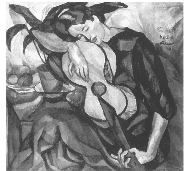
Perlrott Csaba Vilmos: Lány gitárral , 1911 magántulajdon