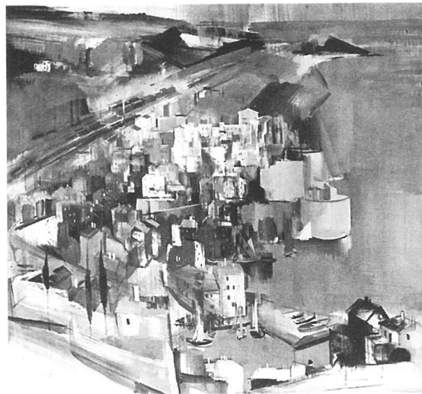
Aba-Novák Vilmos: Cefalu, 1930 (magántulajdon)