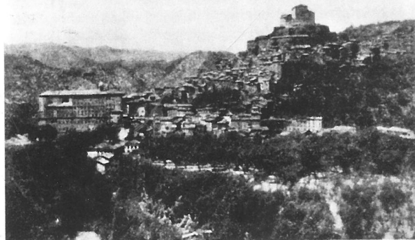
Subiaco látképe (archív fotó)