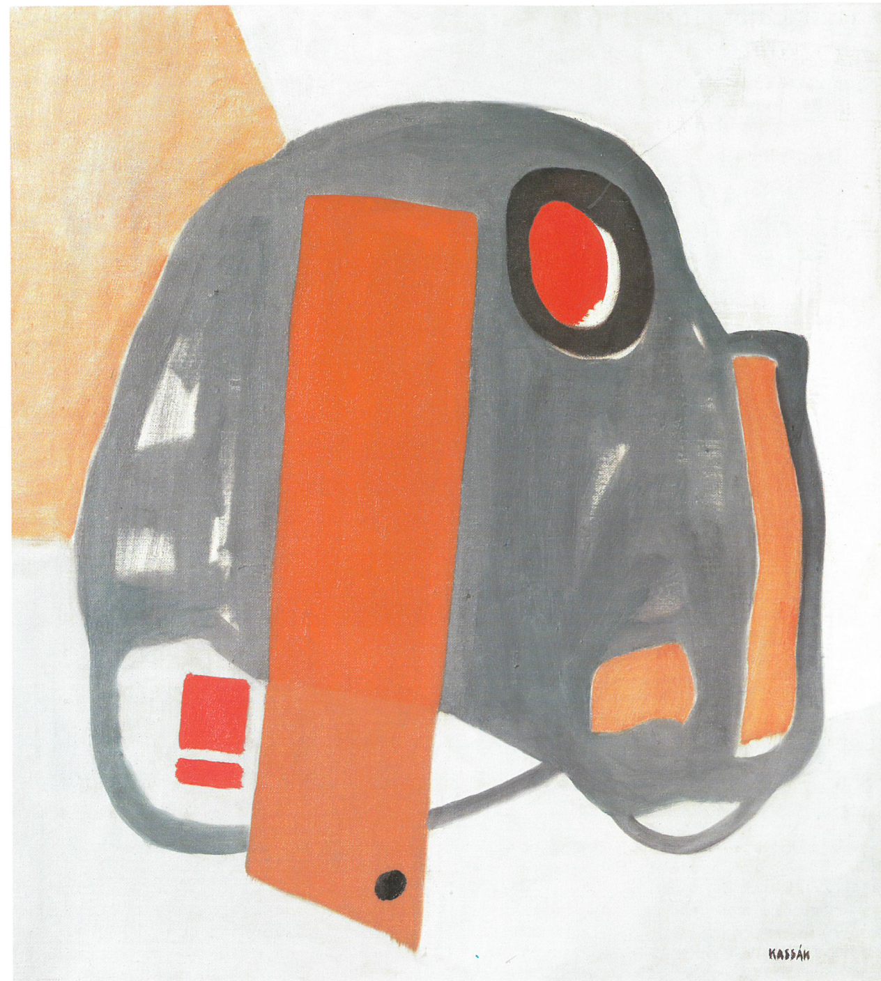
148. ▲ Kassák Lajos (1887-1967)

Mégis mi készítette a hetvenes mestert, hogy elővegye a lassan maga által is értéktelennek hitt korai képarchitektúráit, s az absztrakt formálás szellemében újból munkához látson? Korniss Dezső szerint: "Amikor Kassák az ötvenes években visszatért a képzőművészeti alkotáshoz, nehezen találta meg újra önmagát a festészetben. A régi geometrikus szerkesztményeit nem akarta már csinálni, vagy nem tudta csinálni, vagy úgy látta, hogy nem volna értelme. Ez abból is látszik, amit Békásmegyeren csinált, az teljesen más volt, mint korábbi művésze. - Én 1958-ban voltam újból Párizsban, majd Hollandiában, és miután hazajöttem, beszámoltam neki arról, hogy mi van kint Nyugaton a képzőművészetben. - És hirtelen - 1959 kö-