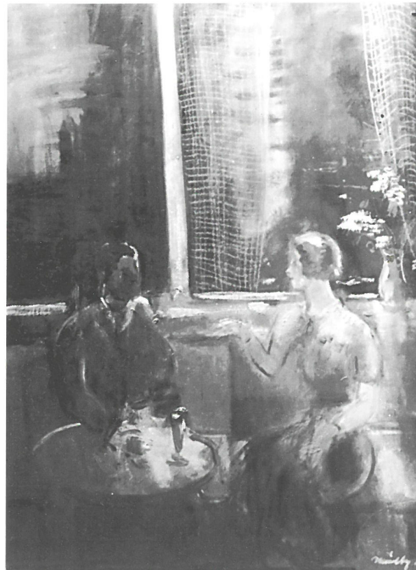
Márffy Ödön: Verandán Csinszkával 1930 körül

"Az impresszív megfigyelésnek már régóta semmi köze képeimhez. Összevont és képpé szublimált emlékeimet festem meg. Nem támaszkodom semmire, illetve csak életem tartalmára, mely szorosan hozzátartozik a való világhoz." (Márffy Ödön)