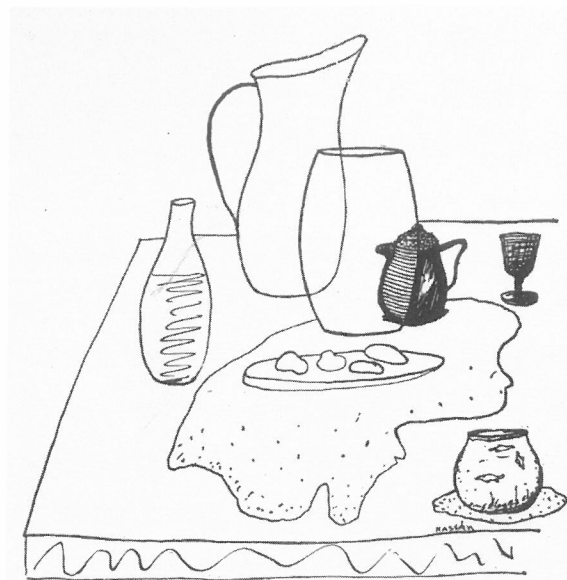
Kassák Lajos: Költemények, rajzok. Budapest 1958.

Az aukción szereplő csendélet-tanulmány is ekkoriban készült. Kassák ezúttal sem törekedett a beállított tárgyak élethű megjelenítésére. A kisasztal felénk tárul bizonytalanul billegő lapjára egyszerű közvetlenséggel helyezte rá a kancsót és a gyümölcsöket. A négyzethálós jelzett padlózat és a csíkozott háttér dekorativitása a modern francia festészet felszabadult térszemléletének ismeretét feltételezi. Az egymáshoz közelálló kékek, szürkék, sötétzöldek és a háttéren végighúzó meleg pasztell vörös finom kontrasztja bensőséges, ugyanakkor izgalmas színhatást eredményez. A hétköznapi tárgyai - vázák, kiöntők, poharak, edények, evőeszközök - tusrajzain is rendszeresen megjelentek. Az 1958-ban kiadott “Költemények, rajzok” kötetben a versekkel