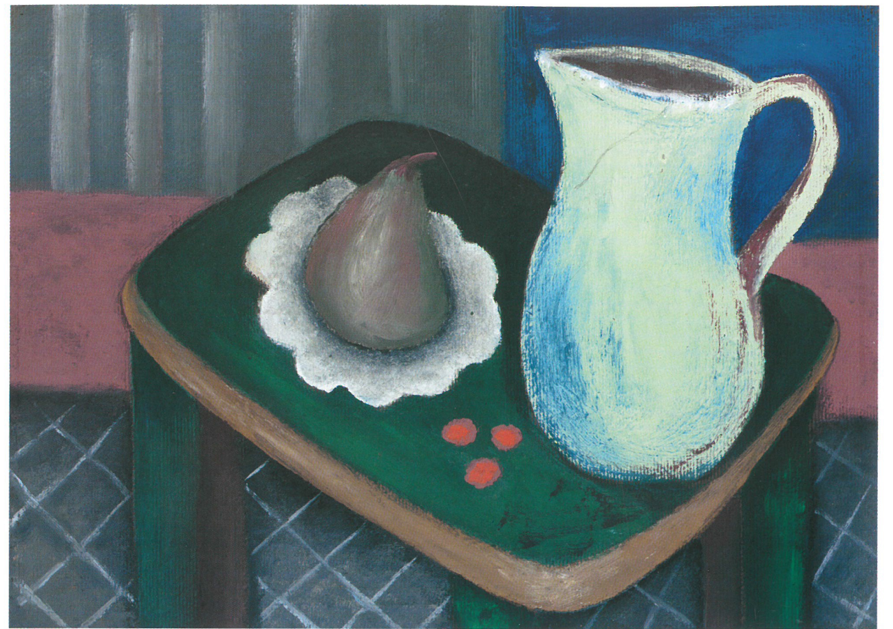
29.▲ Kassák Lajos (1887-1967)

Csendélet kancsóval Tempera, papír 25,5x35 cm Jelezve a hátul: KL. Kikiáltási ár: 450.000 Ft