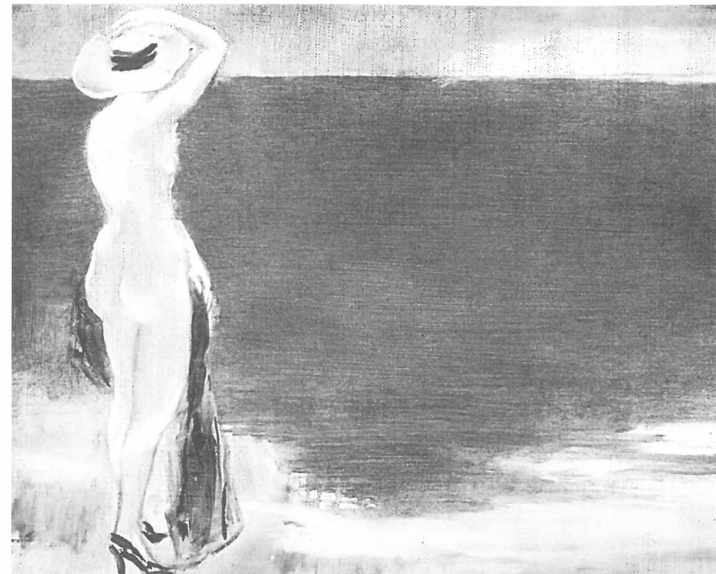
Vaszary János: Akt tengerparton 1938

ilyen kép festésekor, melyet feltehetően sosem megrendelésre készített, Vaszary újra definiálta a festészethez, illetve általánosabban a világhoz való viszonyát.