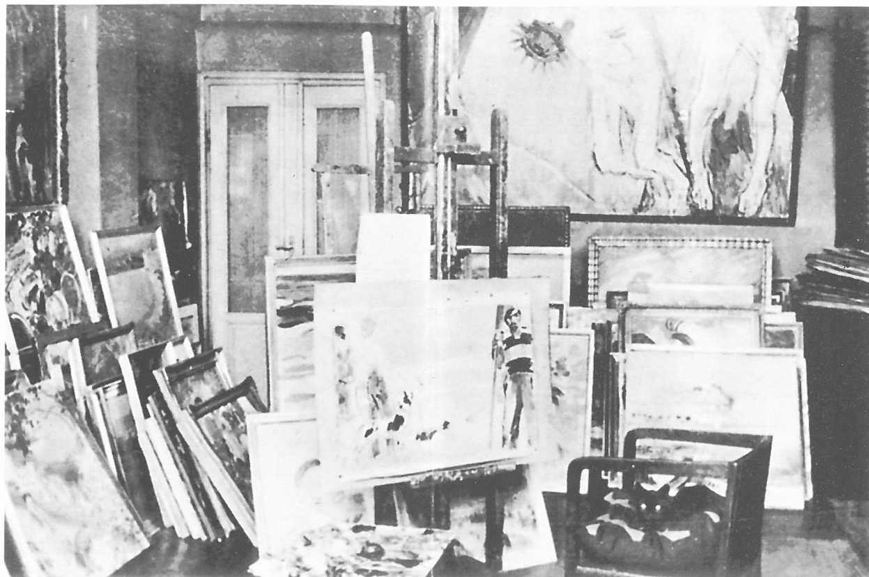
Vaszary János műterme 1939, utolsó festményével, székében kedvenc fekete macskája