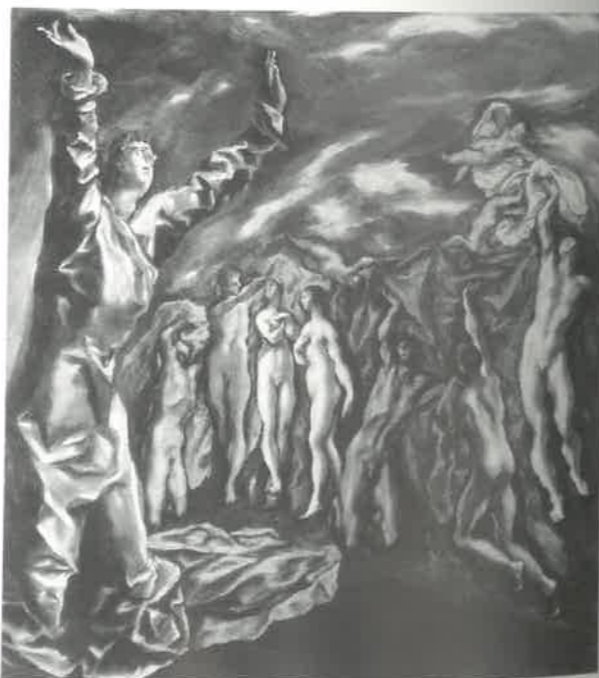
El Greco: Az Ötödik pecsét feltörése, 1608-14, New York, Museum of Art