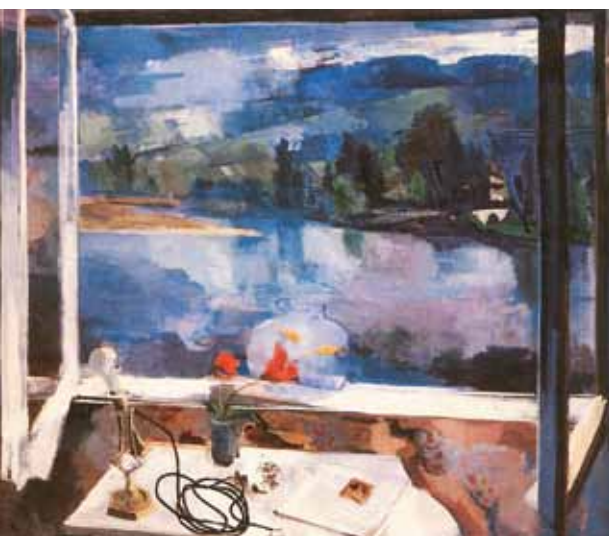
2. Bernáth Aurél: Reggel, 1927 Magyar Nemzeti Galéria, Budapest

festészetének vissza-visszatérő témájává vált az 1920-as évek végétől. Az ábrázolt motívumok gazdag szimbolikáját az örök körforgás gondolköre kapcsolta össze. A téma utolsó, 1959-es változatán egy lemetszett nádszál is feltűnik, melyből a művész mindig tartott budapesti lakásán is néhányat, a lelkével összeforrt balatoni táj mementójaként. Az élet és a halál közötti átjárást a különböző kultúrákban más és más biztosította. Az ókori pszükhopomposzt, azaz a lélekvivőt az egyiptomiaknál Anubisz, a görögöknél Kharrón, a keresztény kultúrkörben pedig angyalok jelenítették meg, de a történelem folyamán lehetett ló, kutya, holló, bagoly vagy éppen varjú is. A Fényt a Sötétségtől elválasztó határon átlibbenő, színpompás pillangók Bernáth magánmitológiájának fontos szereplői, akik szintén a lelkek kísérőiként végzik feladatukat.