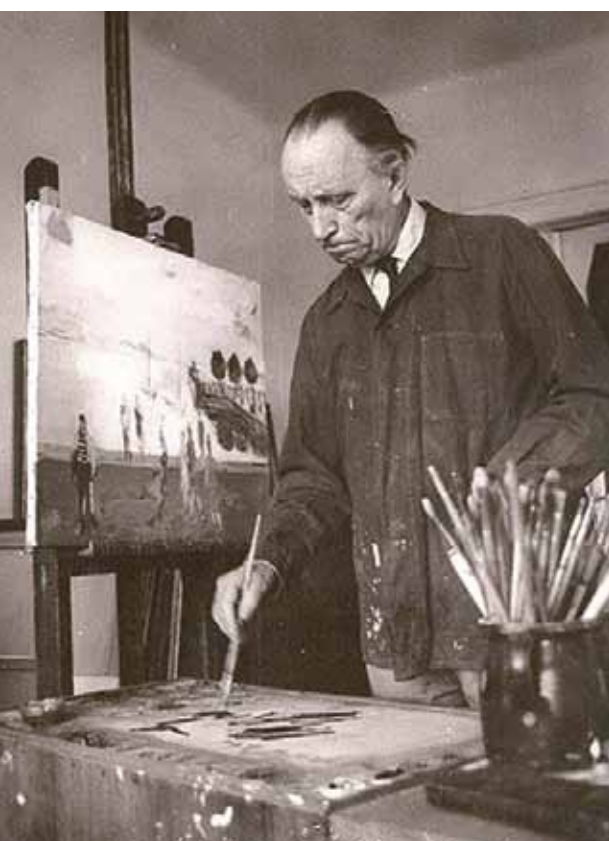
1. Bernáth Aurél műtermében

▶ Original paintings by Europe's finest artists, (Geneva, Guggenheim Gallery), London, 1962. kiállítási katalógus borítóképe ▶ Genthon István: Bernáth Aurél. Képzőművészeti Alap, Budapest, 1964. 42. kép ▶ Pataky Dénes: Bernáth Aurél. Corvina Kiadó, Budapest, 1972. 23. kép ▶ Ezredvég, 2012/3, XXII. évfolyam