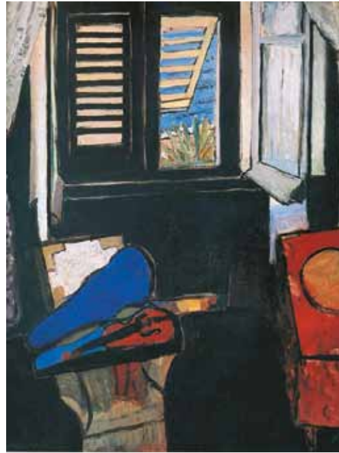
4. Henri Matisse: Csendélet hegedűvel, 1917-1918 Statens Museum for Kunst, Koppenhága, Dánia