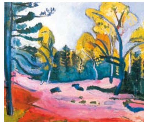
Georges Braque: L'Estaque-i táj, 1906. magántulajdon