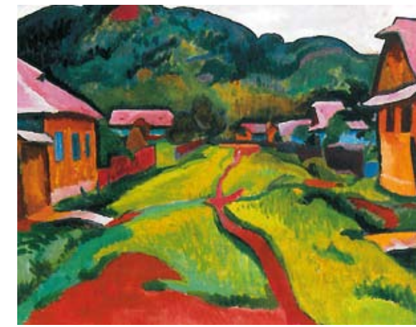
Bornemisza Géza: A Veresvíz utca Nagybányán, 1910 körül, magántulajdon