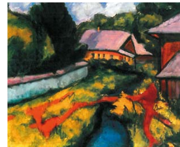
Tihanyi Lajos: Kis tájkép, 1909. Janus Pannonius Múzeum, Pécs

letett ekkoriban. Talán éppen Nagybányához való ragaszkodása miatt nem lett a Nyolcak tagja, holott stílusa és elsősorban a csoport vezérével, Kernstokkal való kapcsolata révén helye lett volna a fiatal társaságban.