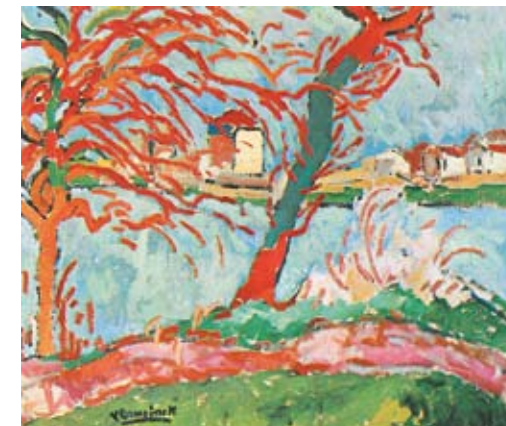
Maurice de Vlaminck: Bouival falu, 1906. magántulajdon