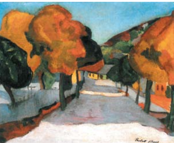
Perrott Csaba Vilmos: Nagybányai utca, 1909. magántulajdon