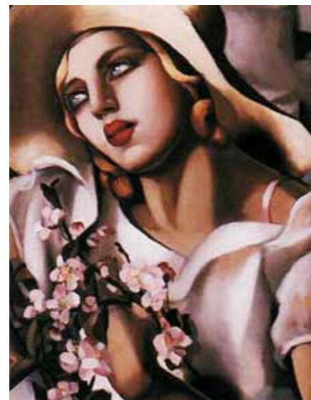
2. Tamara Lempicka: Nő szalmakalappal, 1930

A két háború közti budapesti folyóiratok nem győzték hangsúlyozni, hogy Kádár Béla előbb vált sikeressé külföldön, mint itthon. Berlinben a Der Sturm népszerű és elismert művésze volt, majd amerikai bemutatkozása is pozitív fogadtatásban részesült. Életművének fontos darabjai kerültek így külföldi gyűjtők tulajdonába. Németország és Amerika mellett azonban jelentős kollekciónak került Izraelbe is, amelyben nagy szerepe volt a sikeres és népszerű, magyar származású írónak, Ephraim Kishonnak. Kishon eredetileg Hoffmann Ferencként látta meg a napvilágot 1924-ben, Budapesten, majd a háború után Tel-Avivban telepedett le, ahol fényes nemzetközi karriert futott be íróként és humoristaként. Filmjei Holly-