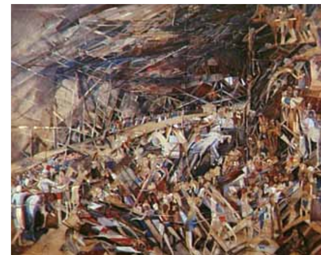
3. Rozsda Endre: Állandó mozgásban, 1963-1965 Centre Pompidou, Párizs