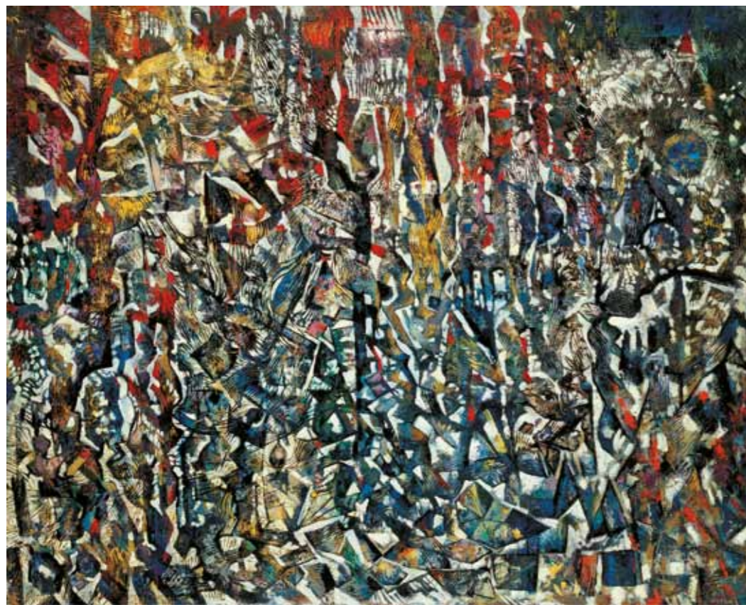
2. Rozsda Endre: La tour de Babel, 1958 Atelier Rozsda

Az 1957–65 közötti, Rozsda-életműben külön időszakként is tekinthető periódust két főbb esemény keretezi, amellyel, hogy megkezdődik Rozsda második franciaországi tartózkodása: az egyik a Galerie Furstenbergben megrendezett egyéni kiállítása; a másik Rozsda szürrealizmushoz fűződő viszonyának nemzetközi elismerése és szürrealista apoteózisa azáltal, hogy André Breton beemeli nevét az ikonikus, festészetről szóló kiadványának 1928 utáni egyetlen bővített kiadásába ( Le Surréalisme et la Peinture , 1965).