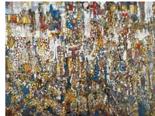
4. Maria Helena Vieira da Silva: Az összeomlás (Az összeomlás vagy a háború), 1942 Centre Pompidou, Párizs