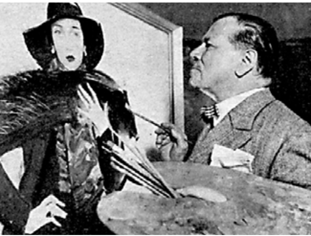
1. Vaszary János festés közben, 1930-as évek