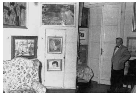
3. Révész István Vaszary-gyűjteménye, 1950-es évek