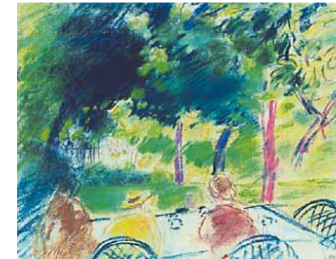
11. Vaszary János: Parkban magántulajdon