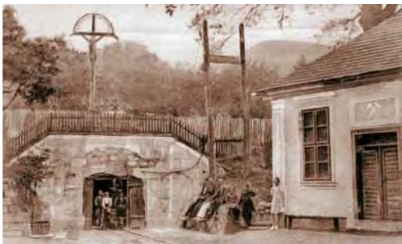
1-2. A Malomárok és környéke Nagybányán, 1900-as évek eleje archív fotó

A művész a magyar vadak egyik legvadabbika volt ekkor, a hazai modernizmus leggyönyörűbb és legintenzívebb időszakának számító 1910 körüli években.