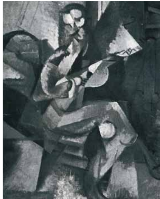
2. Szobotka Imre: Férfi gitárral, 1914 körül lappang

kiindulva kísérelje meg új útkeresését.” Szobotka valóban értő módon, kifejezetten teoretikus alapon alakította sajátos „színes” kubizmusát és a magyarok közül talán ő értette meg leginkább a kubizmus alapelveit, így logikusan, következetesen jutott el az analitikus kubizmus egyéni kidolgozásáig is. A világháború kitörése fejlődését több honfitársához hasonlóan derékba törte és festőtársával Bossányi Ervinnel Saint-Brieuc-ben internálták, ahol már csak apróbb munkákat készíthetett.