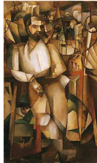
4. Szobotka Imre: Zenesz, 1914 körül lappang