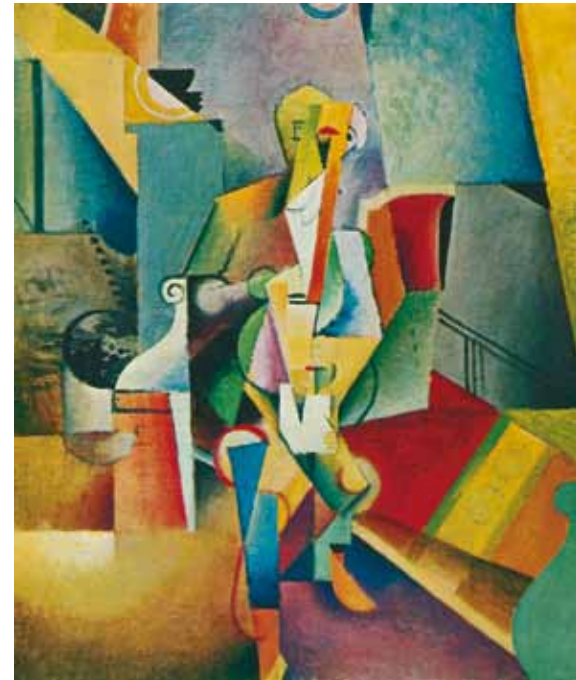
3. Albert Gleizes: Férfi az erkélyen, 1912 Philadelphia Museum of Art