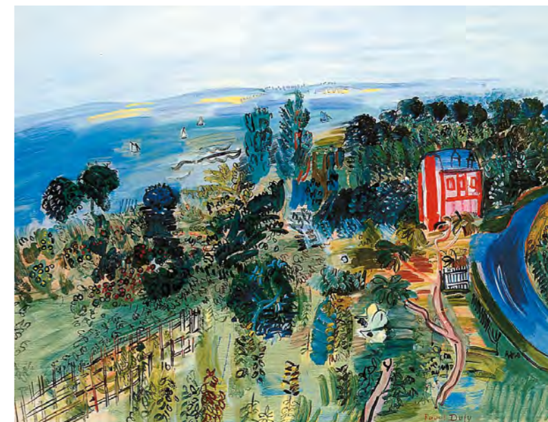
3. Raoul Dufy: Villerville magántulajdon