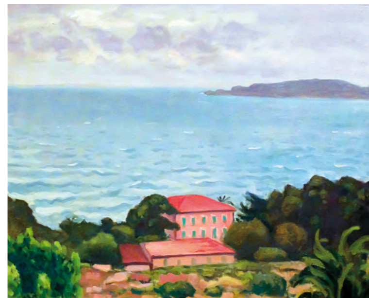
2. Albert Marquet: Toulon kikötő látképe Tokyo Fuji Art Museum, Tokió