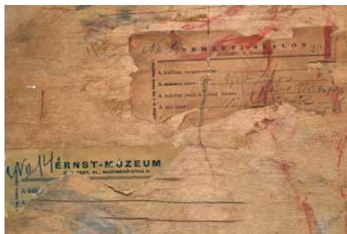
a kép hátoldala