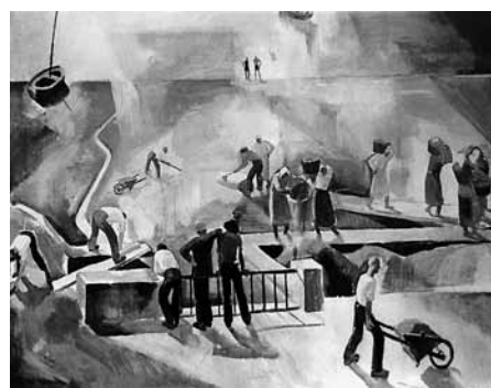
Patkó Károly: Útépités, 1931.