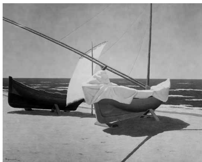
Vagaggini Memo: Bârkák 1933. Gerevich Tibor fotóhagyatéka. MTA MKI Fotótár B 3643.