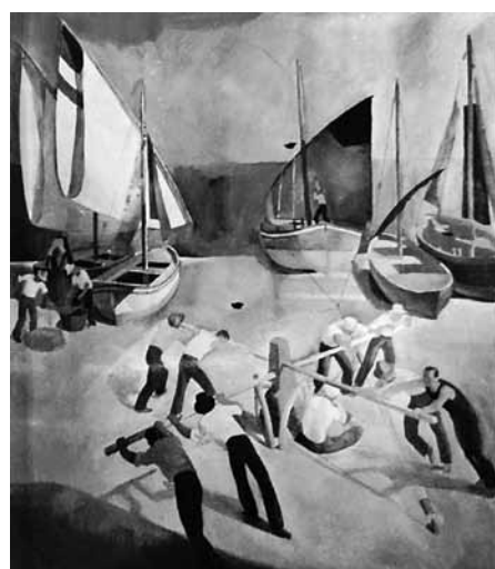
Patkó Károly: BARKAVONTÁS. 1932. Lappang.

Patkó Károly művészetét alapjaiban változtatta meg az a három év, amelyet a Római Magyar Akadémia ösztöndíjasaként Olaszországban töltött. Festészete gyökeres változásokon ment át ekkor, mind tartalmi, mind technikai szempontból. Ez az átalakulás pedig nem csak barátjára és pályatársára, Aba-Novák Vilmosra hatott inspirációs erővel, hanem az egész magyar művészeti élet számára is jelentős hatással bírt.