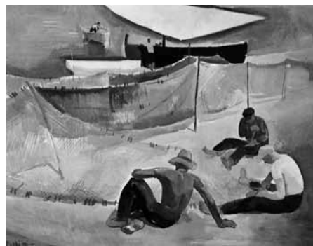
Patkó Károly: Hálójavítás.