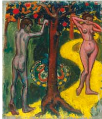
Tihanyi Lajos: Ádám és Éva, 1907 (A festő Pont St. Michel című alkotásának hátoldala) magántulajdon