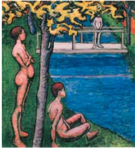
Tihanyi Lajos: Fürdőzők Magyar Nemzeti Galéria, Budapest