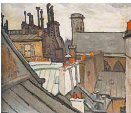
3. Albert Marquet: Háztetők, 1910 körül, magántulajdon