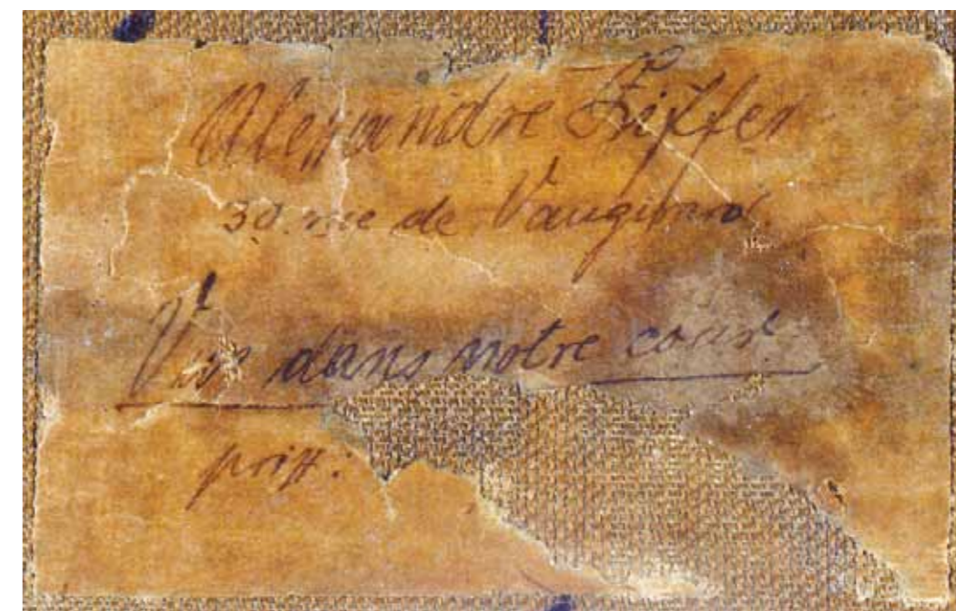
6. Ziffer Sándor: Hajók a Szajján , 1911. Magyar Nemzeti Galéria, Budapest 7. Jelen képünk hátoldalán található raglap