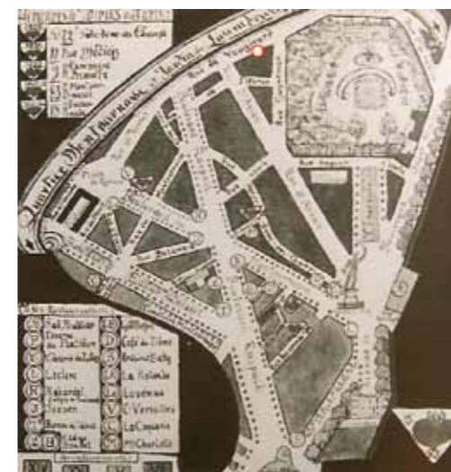
5. A Rue de Vaugirard Edvard Diriks térképén, 1899–1923 között