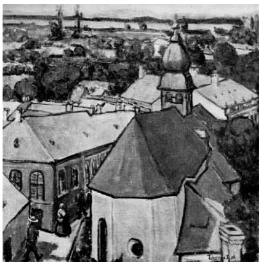
2. Tihanyi Lajos: Nagybányai utcarészlet, 1908, Magyar Nemzeti Galéria, Budapest