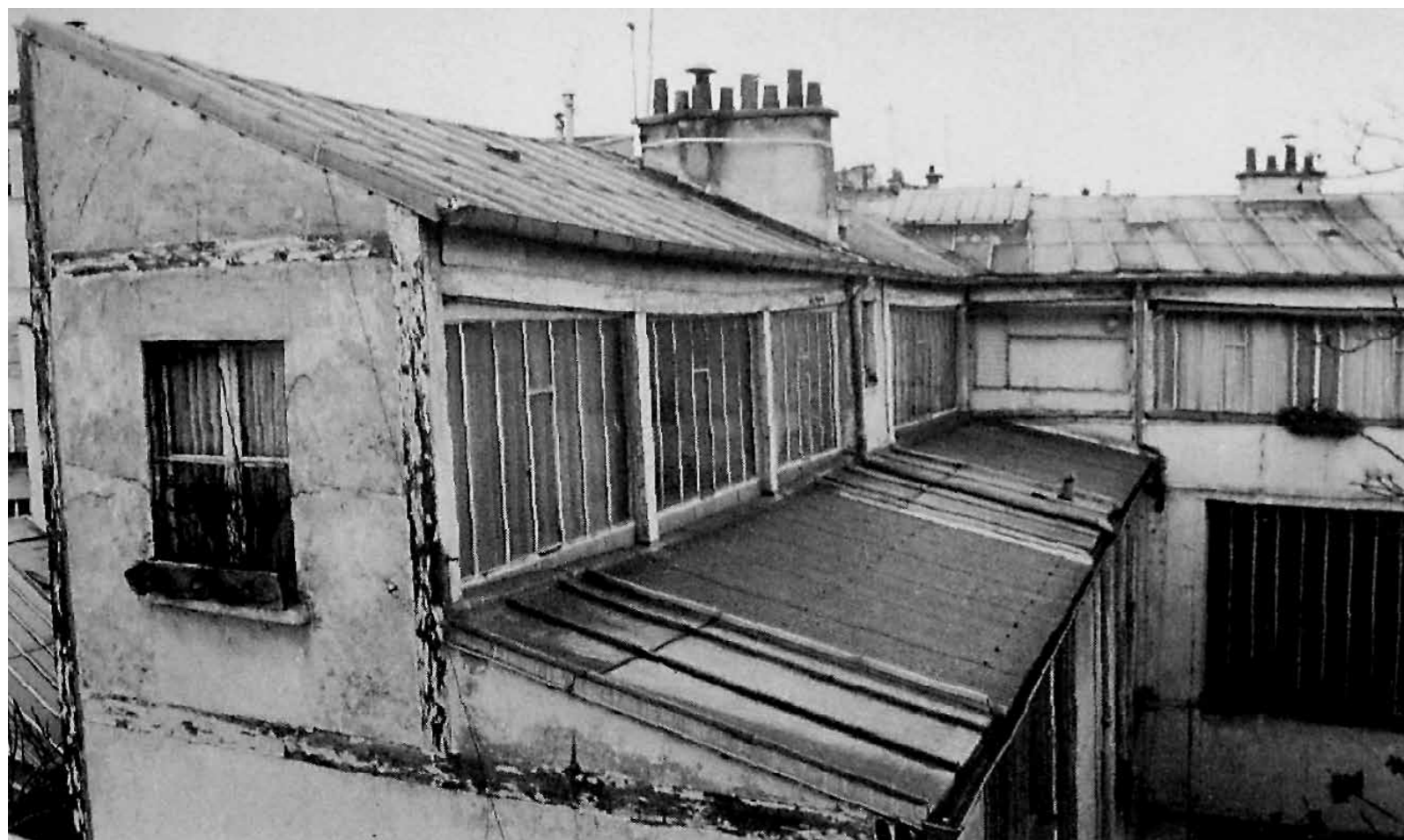
1. Műteremház a Rue de la Grande Chaumière-n