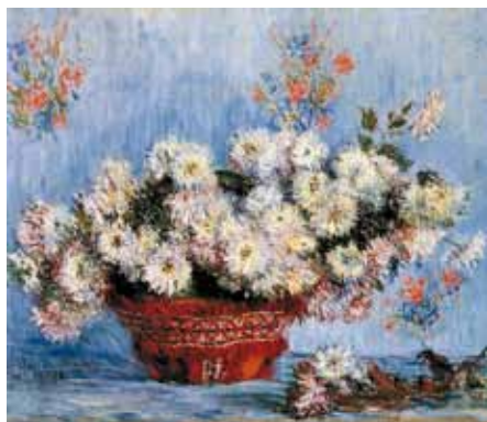
Claude Monet: Krizantémok, 1878. magántulajdon