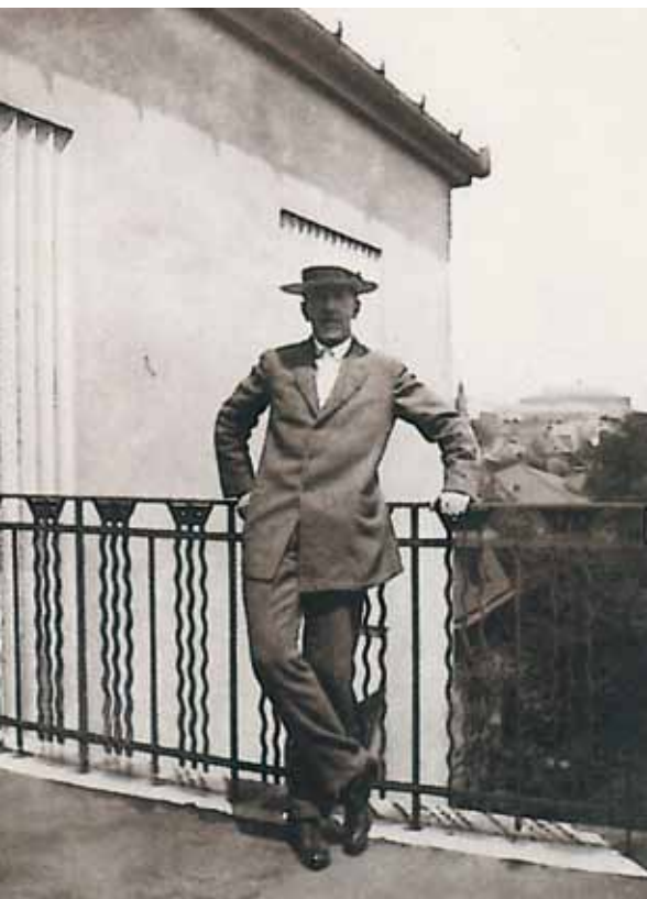
Ferenczy Károly a teraszon, 1910-es évek