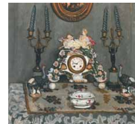
Fényes Adolf: Csendélet porcelánórával, 1910 körül Janus Pannonius Múzeum, Pécs