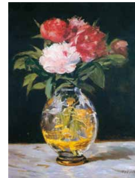
Edouard Manet: Virágcsokor, 1882. Murauchi Art Museum, Tokio