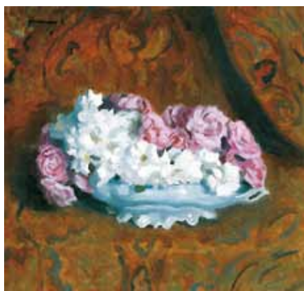
Ferenczy Károly: Rózsaszín és fehér rózsák tálon, 1911 magántulajdon

E csendéletek kompozíciója és eszmeisége, a Ferenczyhez hasonlóan szintén a klasszikusokkal viaskodó, az önreflektív, „múzeumi” művészettel kísérletező Manet műveivel mutatnak rokonságot. A két festő párhuzamba állítása az aszparáguszos és az ananászos csendéleteik összehasonlítása mentén válik különösen izgalmassá. Mindkét festő szeme előtt a klasszikusok, elsősorban Tiziano és Velázquez festőisége és szellemisége jelenhetett meg, amikor hozzáfogtak egy-egy kompozícióhoz.