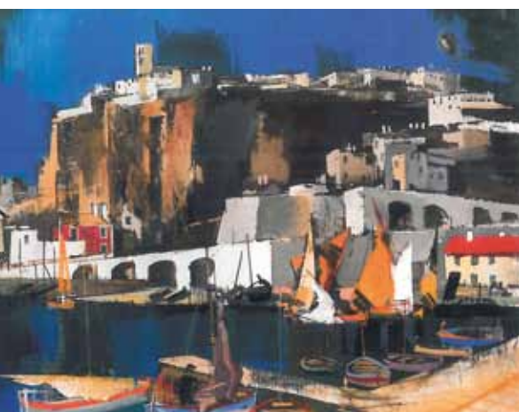
Aba-Novák Vilmos: Öböl, 1930 magántulajdon