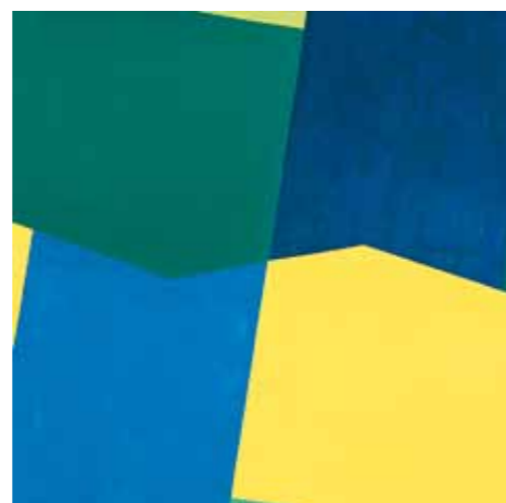
A festmény hátoldala

A most aukcióra kerülő Napraforgó-változat még erősen az op-art jellegzetességeit viseli magán. Hiányzik belőle a jellegzetes kvázitranszparencia, amely révén Fajó az egymáson átmetsződő geometriai formáknak térbeliségét hangsúlyozza, de a kompozíciót kitöltő napraforgó-forma kontúrjai már e korai műben átveszik a képkeret szerepét, általa pedig a mű részévé teszik a környező világot. A jelzés szerint Fajó negyven évvel később, 2006-ban festette le a Napraforgó hátoldalát, immáron tipikus „fajós” stílusban, elhagyva minden sallangot és kötöttséget. Itt már, rá jellemzően, a tükörsima színek (az érzelem) és a formák (az értelem) egyszerű, és mégis bonyolultabb alapforma-variálása érdekli, melyben hangsúlyos szerepet kapnak a formatalálkozások: az élénk színű konkáv sokszögek „kiharapnak” egy-egy területet a másiktól, ezáltal a képfelület intenzitása megváltozik.