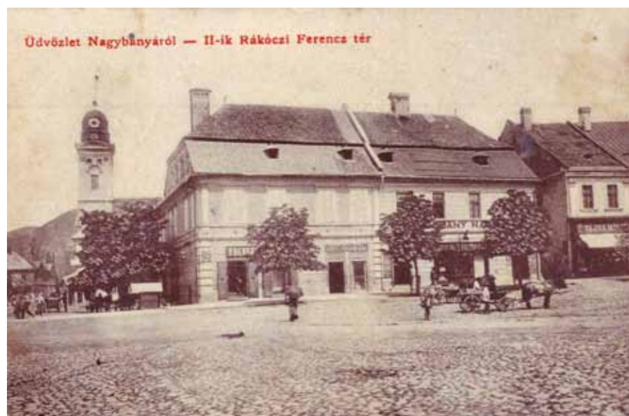
1. Nagybányai képeslap