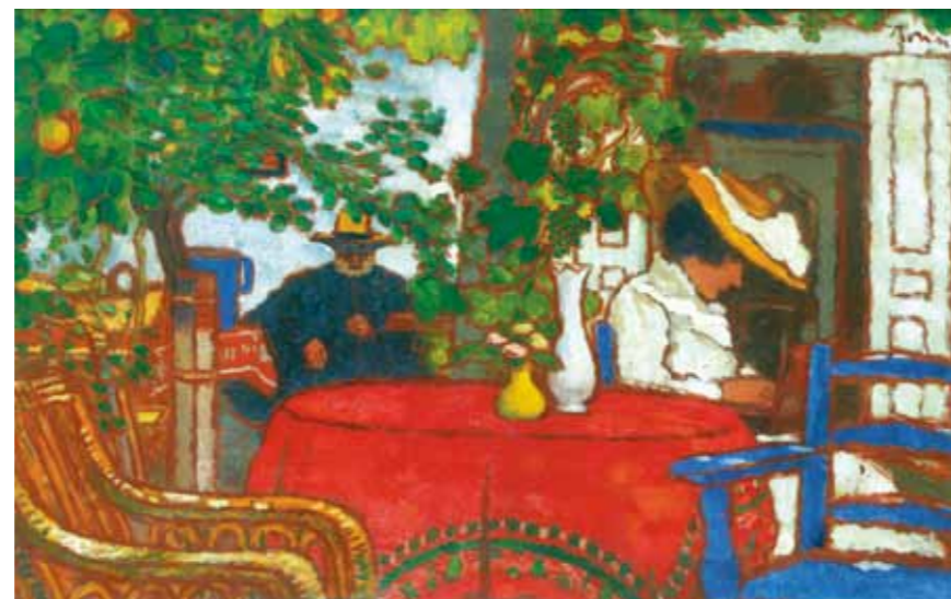
2. Rippl-Rónai József: Csendes délután a Róma-villa kertjében, magántulajdon