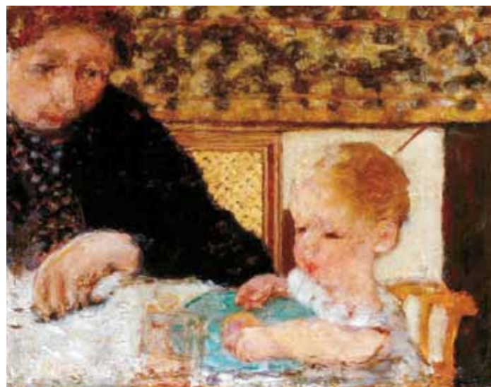
1. Pierre Bonnard: Nagymama gyermekkel, 1894. Szépművészeti Múzeum, Budapest