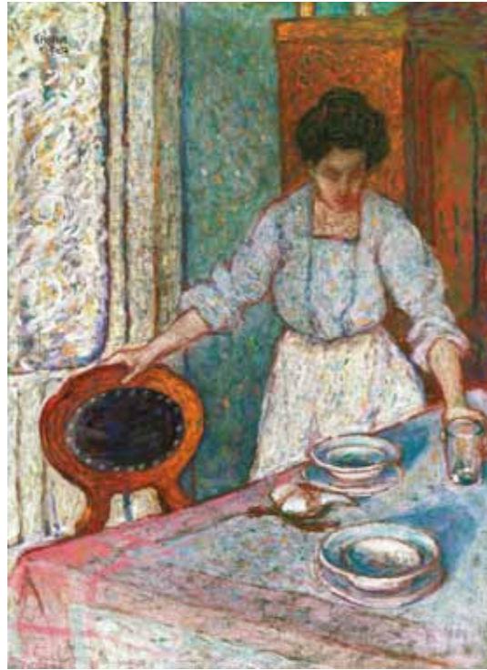
5. Kádár Béla: Vacsora előtt, 1910 körül, magántulajdon