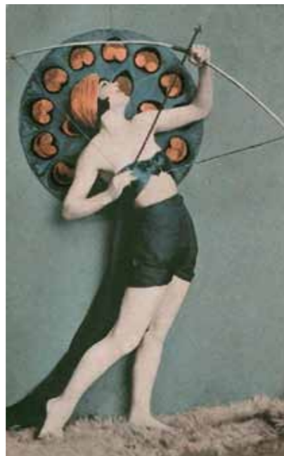
5. Divalfotó az 1920-as évekből