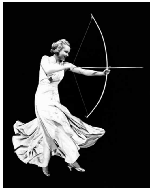
4. Divalfotó az 1920-as évekből

mot. Cégüket találékonyság és művészi igényesség jellemezte, amellyel hamarosan nagy ismertségre tettek szert. Az első világháború utáni nehéz években elefántcsont ékszerek faragásából tartották fenn magukat. Cégük Preiss haláláig, 1943-ig működött. Halála előtt Preiss, aki tisztában volt tárgyainak művészi kvalitásaival, megjósolta, hogy szobrai egyszer még nagyon értékes, keresett gyűjtői darabok lesznek.