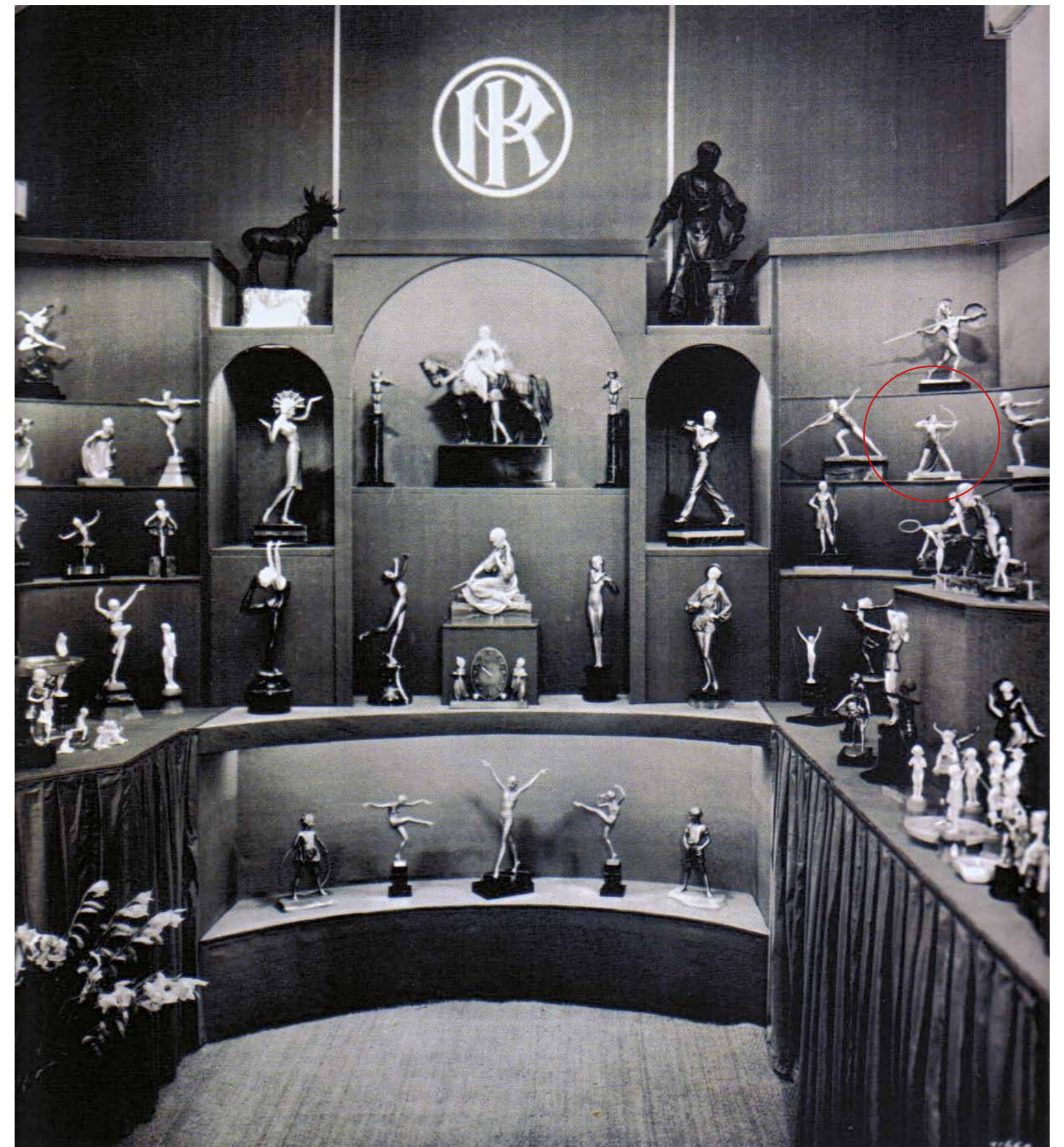
7. A Lipcsei vásár 1930-ban. Diana figurája a jobb oldalon, felülről a második polcon középen látható.