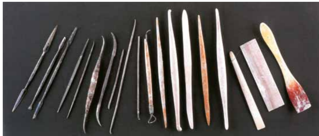
1. Ferdinand Preiss szerszámai

Kezdő ár: 14 000 000 Ft / 45 016 EUR Becsérték: 20 000 000 - 25 000 000 Ft Estimated value: 64 309 - 80 386 EUR