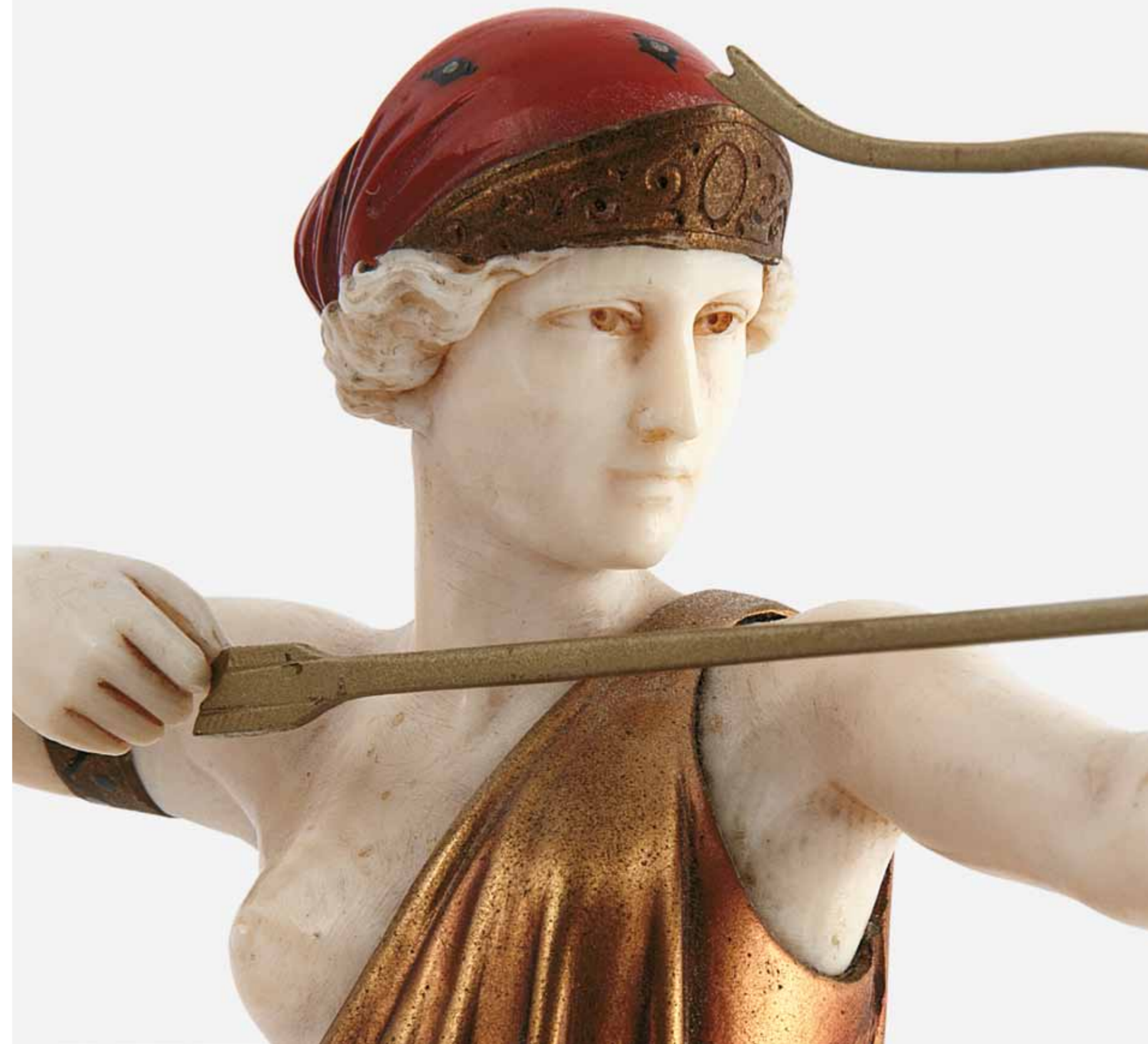
8. Preiss nagy hangsúlyt fektetett a szobrok arcának egyedi formázására