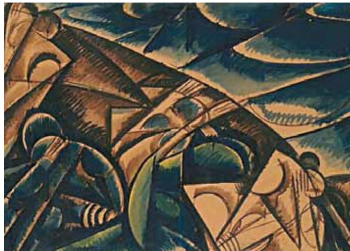
4. Uitz Béla: Kompozíció a Halászkok témájára, 1920 Magyar Nemzeti Galéria, Budapest