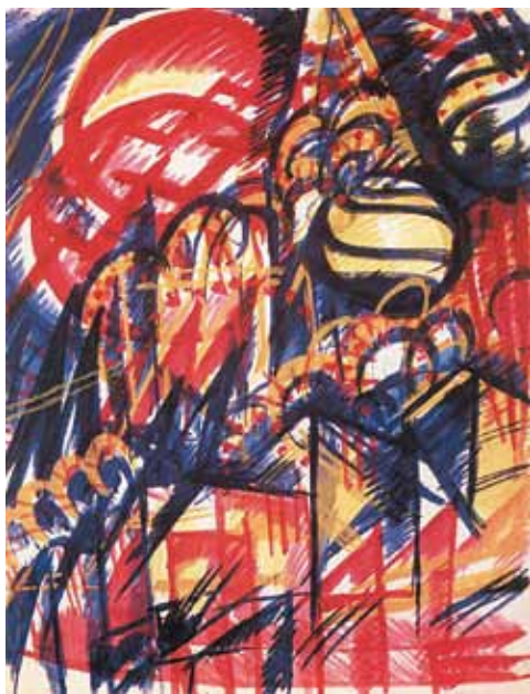
5. Uitz Béla: A moszkvai Vaszil Blazsennij székesegyház részlete, 1921 Magyar Nemzeti Galéria, Budapest

Franciaországi tartózkodásának záróakkordja volt Uitz Collioure-ban tett látogatása 1925 nyarán. Választása nem lehetett véletlen. Ez a dél-francia halásztelepülés a fauve festészetnek köszönheti hírnevét. 1905-ben Henri Matisse és André Derain itt készítették azokat a radikálisan új szemléletű tájbrázolásait, melyek az 1905-ös őszi szalonban „kirobbantják” a fauveizmus mozgalomát. Uitz francia tartózkodása alatt „[...] addig nem tapasztalt mértékben épített új meg új elemeket művészetébe. Más és más oldalról, rendre próbára tette tehetségét. A művészet általános válsága idején konok útkeresése közben Uitz – sokszor művészetének kárára is – más-más hagyományú és lényegű mozzanatokkal és feladatokkal ütközött.” 1 Ilyen kihívás lehetett számára Collioure és a fauve hagyomány is. Két évtizeddel a francia vadak szárnypróbálgatásai után látogatott el ebbe a faluba, ahol a lenyűgöző táj expresszív kompozíciók festésére inspirálta. A Párizsban készített realista ízű munkák, valamint konstruktív szemléletű városrészletei után, Collioure-ben a felszabadult munkának, az életműből lassan kiapadó expresszivitásnak engedett szélesebb teret a művész.