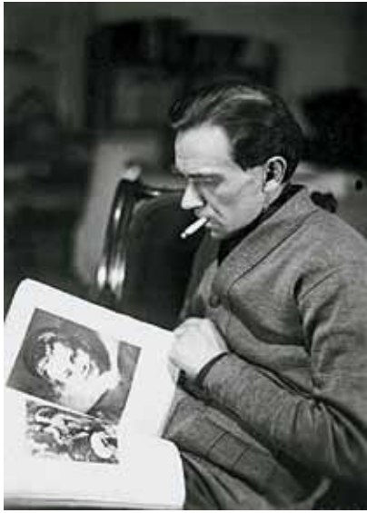
1. Mácza János arcképe, 1920-as évek