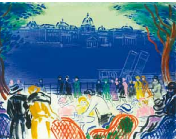
Vaszary János: Duna-parti korzó, 1934 körül, magántulajdon