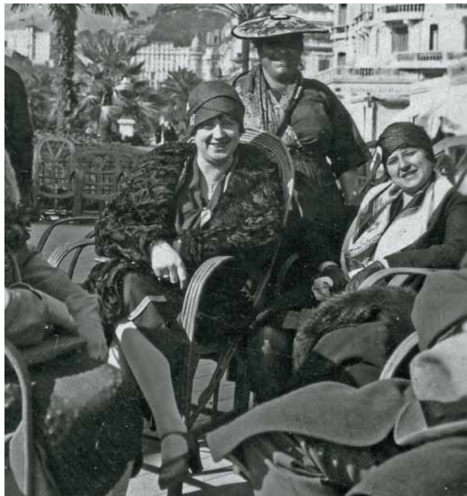
Hölgytársaság az olasz tengerparton, 1927