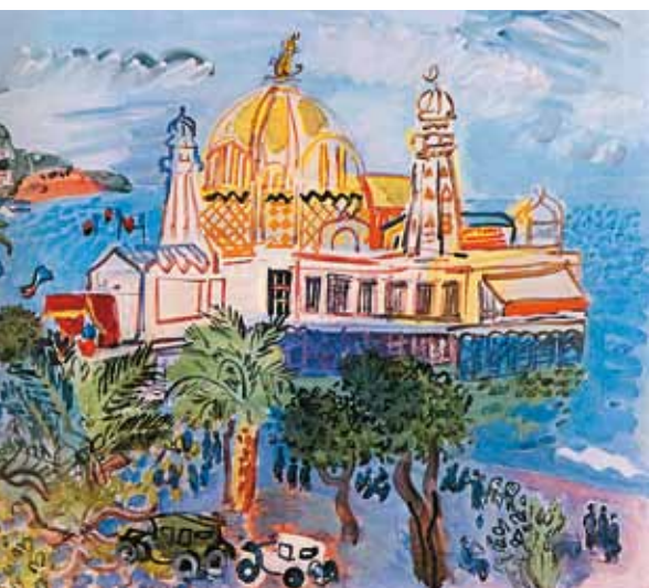
Raoul Dufy: Nizzai részlet, 1929 magántulajdon