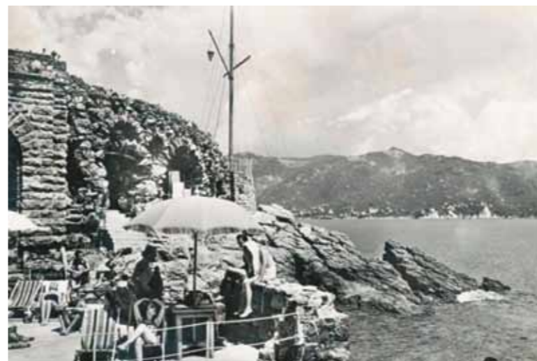
2. A Ligur tenger partján, 1930

kékek és „sajgó” zöldek között barangolva, barátjával versengve vetették papírra ceruzával és vízfestékekkel élményeiket, hogy azután nyugodt, műtermi körülmények között dolgozhassák táblaképekké a megtalált gyönyörűségeket. Erre 1929 tele és 1930 tavasza között került sor, már Rómában, a kezdeti nehézségek után immár munkavégzésre is alkalmassá vált Palazzo Falconieriben. Aba-Novák 1930. június 4-én távozott innen, és pár nap múlva már Budapesten volt. Az Itáliában töltött hónapok gyökeres változást hoztak művészetében, mely életműve további részét is meghatározta.