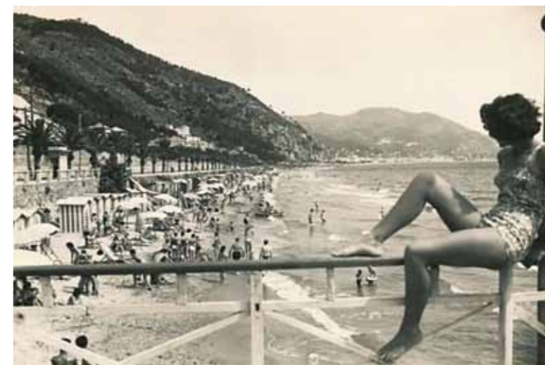
3. Alassio, a Ligur tenger partján, 1940

„Művészi problémáinak megoldásához legszívesebben architektúrás, hegyes olasz tájat választ. A hegyen emelkedő vagy dombra kúszó középkori olasz városok – Perugia, Assisi, Subiaco – egyszerű, tömeges épületeikkel, szilárd falakkal kitűnő alkalmat adnak művészi elvei megvalósítására. Vedutái azonban nem szolgálnak pontos útleírással, földrajzi vagy műemléki hűséget is hiába keresünk bennük, nem is futó emlékképek, hanem belülről konstruált és kivetített látomások. Római korszakának e művei megkapóan éreztetik a patinás, ütött-kopott, múltba merülő, merengő rokkantságuk ellenére is fenséges olasz városokának hangulatképét.” – írta a művész új képeiről Gerevich Tibor 1931-es Római magyar művészek című tanulmányában. Gerevich, aki a Római Magyar Akadémia megalapításával elévülhetetlen érdemeket szerzett a magyar kultúrának, a művész új technikájára is kitért írásában: →