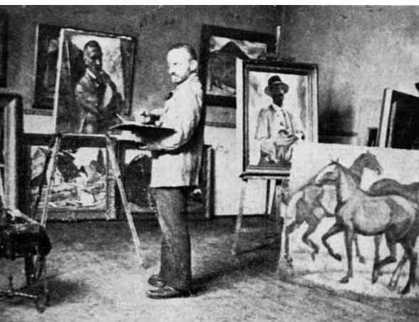
Ziffer Sándor műtermében, 1920-as évek