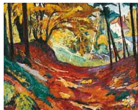
Ziffer Sándor: Német erdő, 1917 magántulajdon