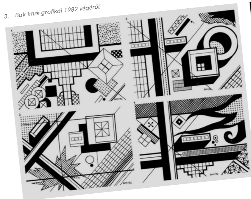
3. Bak Imre grafikái 1982 végéről