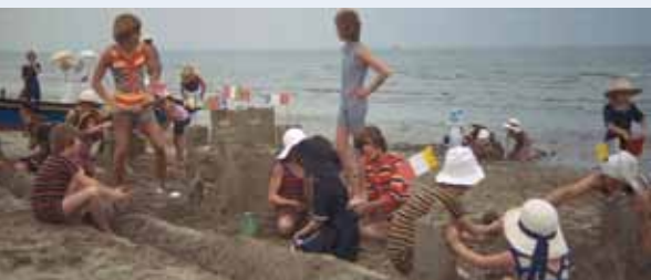
Jelenetek Luchino Visconti Halál Velencében (1971) című filmjéből