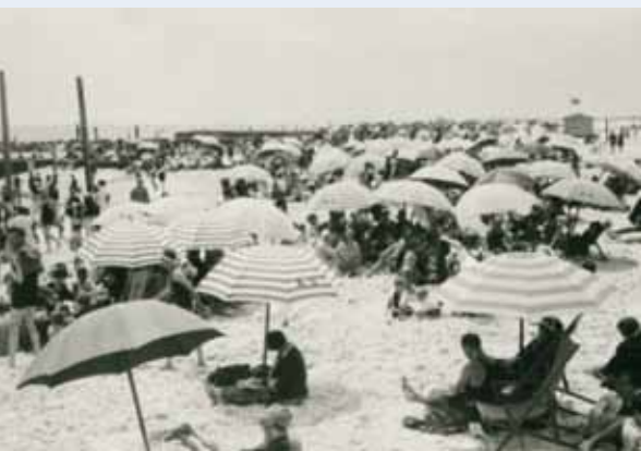
Strandolók az 1920-as években