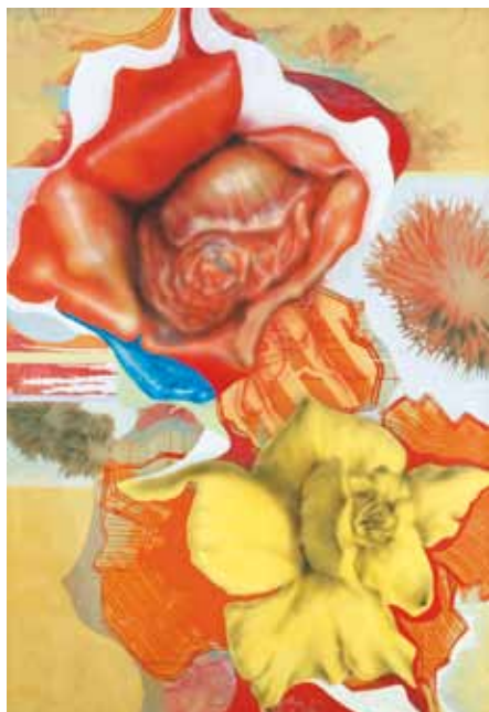
Siskov Ludmil: Rózsák, 1967, magántulajdon