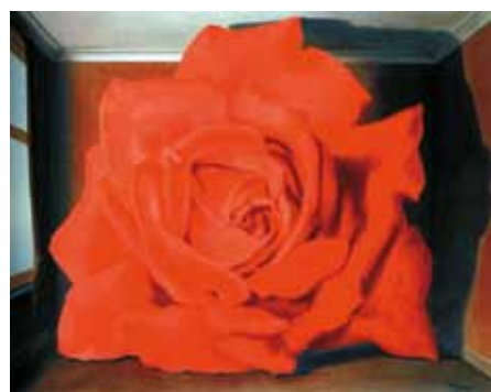
René Magritte: A harcosok sírja, 1960, magántulajdon

(Jelen mű a Rózsák című 25 darabos alkotás részlete, négy darab – A teljes méret: 250 × 200 cm, 25 darab, darabonként 50 × 40 cm)