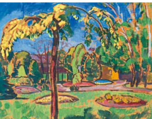
5. Iványi Grünwald Béla: Parkrészlet Kecskeméten, 1911-1912 magántulajdon