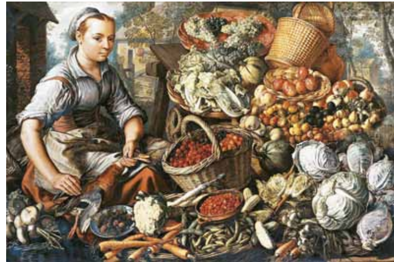
1. Joachim Beuckelaer: Piaci jelenet gyümölcsökkel és zöldségekkel, 1564 Mauritshuis, Hága

Csernus 1970 körül kezdődő korszakát a „Figuration narrative” vagy a „Nouvelle figuration” jelenségéhez, elsősorban Jacques Monory, Gilles Aillaud és Bernard Rancillac festészetével állította párhuzamba a szakirodalom. Míg azonban a fenti művészek elsősorban az amerikai pop art, vagy a hiperrealizmus irányzatához kapcsolódtak, addig Csernus festészetében már akkor az európai festészeti tradícióhoz való kötődés dominanciája érvényesült. Piktúráját kif-