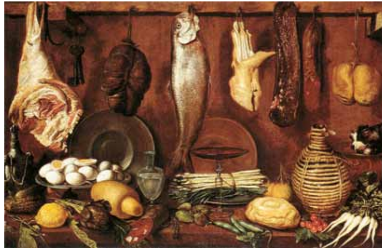
1. Jacopo da Empoli (Jacopo Chimenti): Konyhai csendélet, 1625 körül Puskin Múzeum, Szentpétervár

▶ Csernus Tibor festőművész retrospektív kiállítása. Műcsarnok, Budapest, 1989. március 2. – április 9. életmű-válogatás: 58. ▶ Csernus Tibor. Szerk: Varga Zsuzsa, Dürer Kiadó, Gyula, 2000. 39. kép