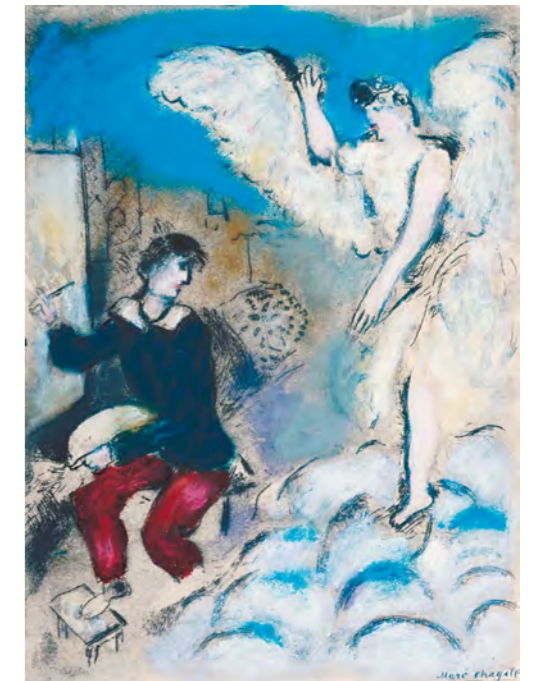
3. Marc Chagall: Látomás, 1937 Tate Gallery, London

Az Önarckép anyyallal Ámos optimista képei közé tartozik. A kép háttérében Szentendre részletei bukkannak fel. Naplójában a kisvárosról épp 1939-ben, e kép keletkezésének évében írt a legtöbbet, amely a festő szerint tele van „ készen komponált témákkal ”. Szentendre kulisszái azonban nem a maguk természetes látványában jelennek meg a festményen. A részletek fragmentumszerűek, töredezetek, akárcsak a kép középterében látható korlát motívuma.