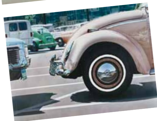
2. Don Eddy: Untitled (Volkswagen), 1971 MUMOK, Wien