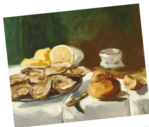
1. Édouard Manet: Csendélet osztrigával, citrommal és süteménnyel, 1862 magántulajdon

REPRODUKÁLVA | REPRODUCED: | Csernus Tibor festőművész retrospektív kiállítása. Műcsarnok, Budapest, 1989., életmű válogatás: 34.