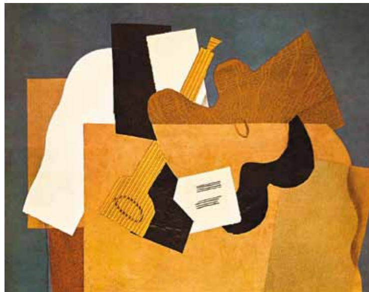
6. Georges Braque: Gitar és klarinét, 1918 (kollázs)