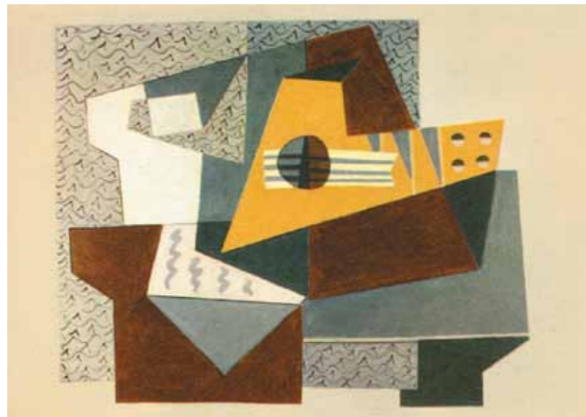
7. Pablo Picasso: Gitar, 1924

Akár a KUT, akár az UME progresszív szárnyának képviselőit tanulmányozzuk, jól látható, hogy az új nyugati impulzusok soha sem „vegytisztán”, hanem – egy jó adag egyéni ízzel megspékelve – egymással párhuzamosan jelennek meg az egyes életművekben. Stílusát legkövetlenebbül Molnár Farkas és Stefán Henrik befolyásolhatták a 1920-as évek második felében.