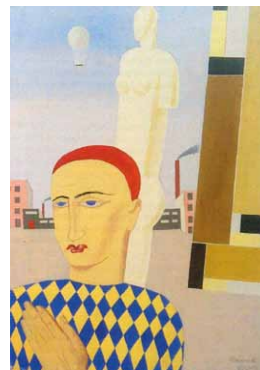
3. Molnár Farkas: Harlekin, 1926 magántulajdon