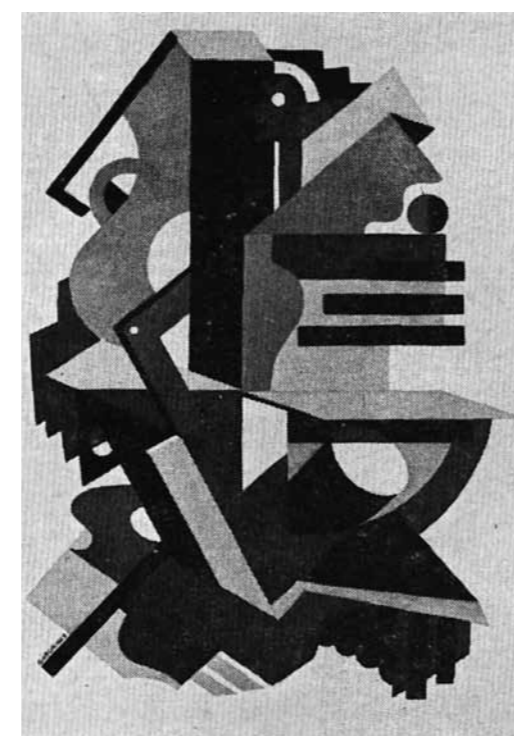
5. Gábor Jenő: Kollázs II., 1927 Janus Pannonius Múzeum, Pécs