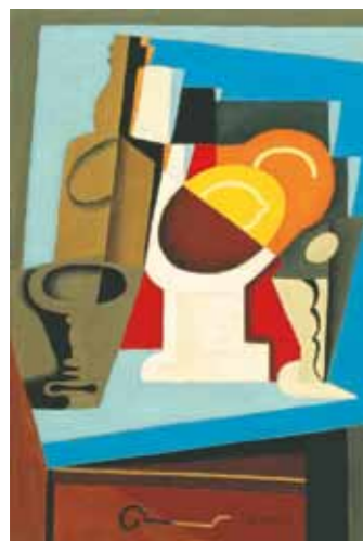
9. Juan Gris: Gitar és gyümölcs, 1911-1919 magántulajdon