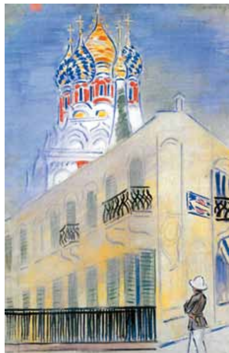
Vaszary János: San Remo-i orosz templom, 1937, Magyar Nemzeti Galéria