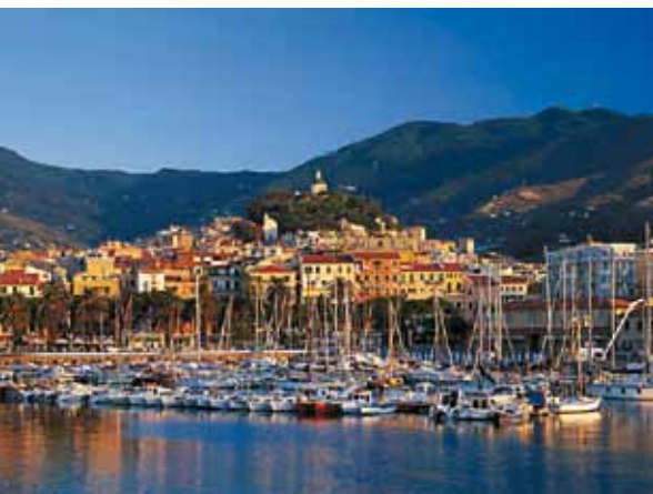
San Remo látképe