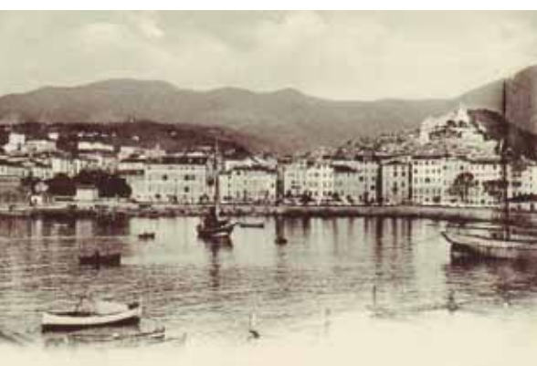
Kikötő San Remoban, az 1930-as években