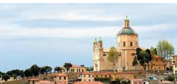
Madonna Della Costa szentély San Remoban