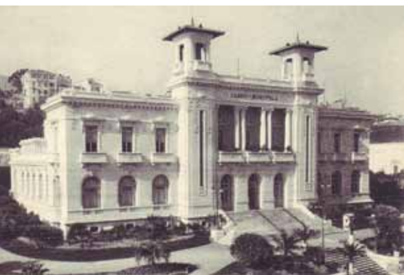
San Remo, Casino Municipal