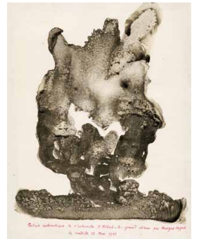
4. Georges Hugnet: Albertus Magnus automatájának automatikus portréja , 1938 Scottish National Gallery, Edinburgh