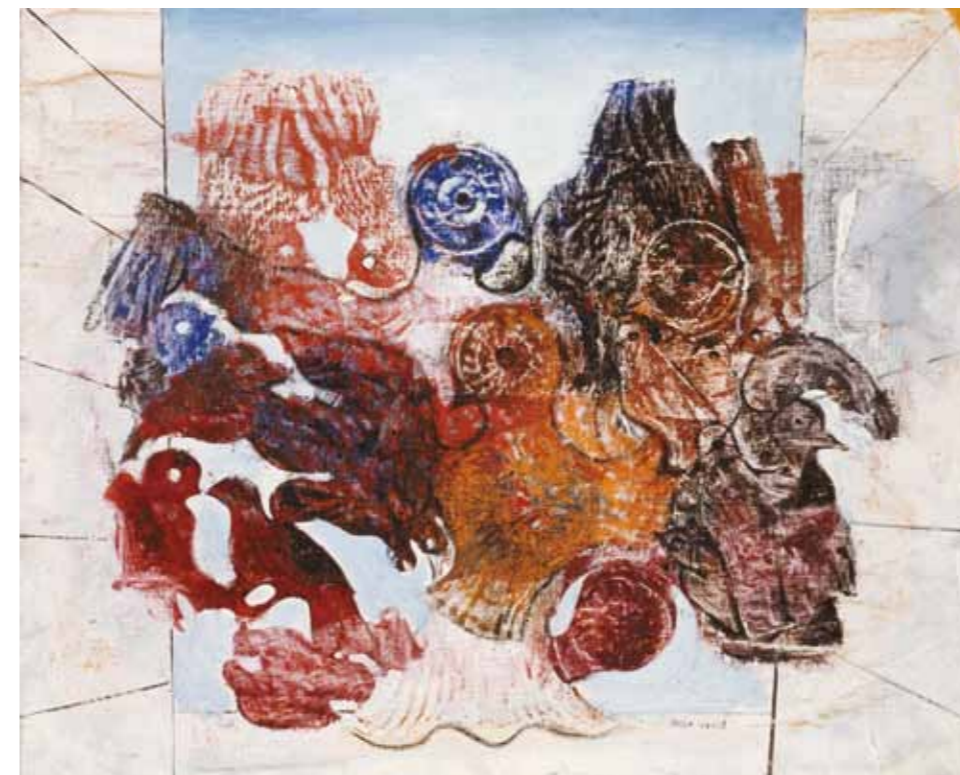
3. Max Ernst: Vörös madarak , 1926 Museo Nacional Centro de Arte Reina Sofía, Madrid

A Broyage du vide a szürrealizmus és a modernista absztrakció határmezsgyéjén helyezkedik el, és a művész első párizsi kiállításán bemutatott absztrakt festményekhez hasonlóan, egy kivételes történeti pillanat dokumentuma. A totális automatikus írás, azaz a fizikai, testi automatizmust példázó vászon létrehozásakor Reigl egyszerre használta és haladta meg a szürrealista automatikus írás módszerét és kereteit. Ahogy 1990-ben, Yves Michel Bernarddal folytatott beszélgetésben mondta, „magával a szürrealizmussal lépett túl a szürrealizmuson.”