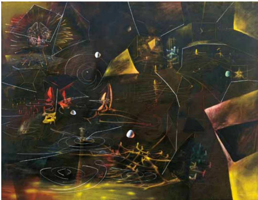
2. Roberto Matta: Erősz mámore (Le Vertige d'Eros), 1944 The Museum of Modern Art, New York

Az alapszínekre épülő, de a kristályok és a fémek szivárvány fényű tónusait idéző festményen a kozmikus térben Möbiusz-szalagként csavaródó formák feszülnek egymásnak. A simára csiszolt alapra Reigl kézzel vitte fel a tubusból kinyomott színes olajfestéket, majd az előbb tenyérrrel simított, aztán az összegyűrt papírdarabokkal leitatott felületeket egy függőnyrúddal dolgozta meg. A két kézzel fogott, hajlított eszközzel a még nedves festéket lendületes és erőteljes mozdulatokkal kaparta le a vásznonról.