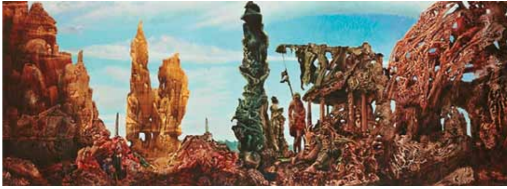
1. Max Ernst: Európa az eső után, 1940-1942 Wadsworth Atheneum, Hartford, Connecticut