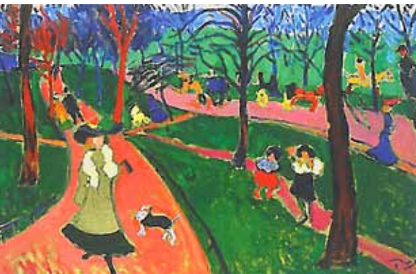
André Derain: Hyde Park, 1905 körül