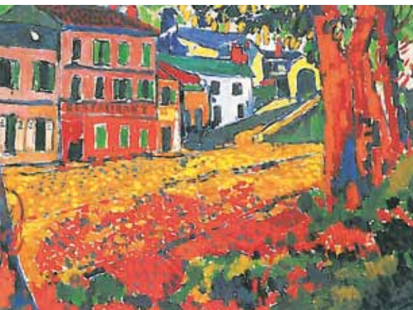
Maurice de Vlaminck: Restaurant de la Machine à Bougival