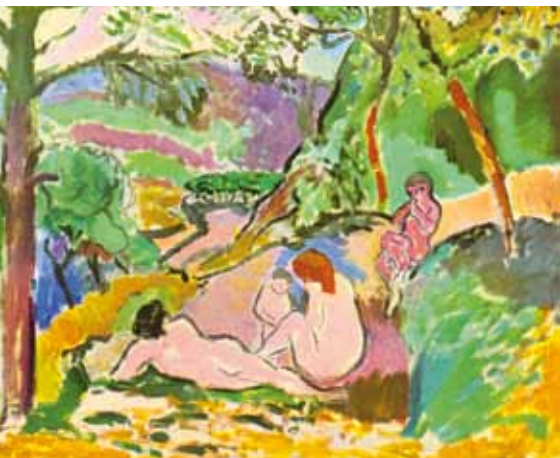
Henri Matisse: Pastorale Musée d'Art Moderne de la Ville de Paris 1905