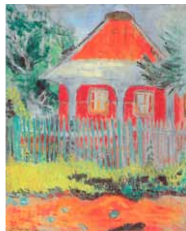
Schönberger Armand: Vörösfalú ház , 1910 körül