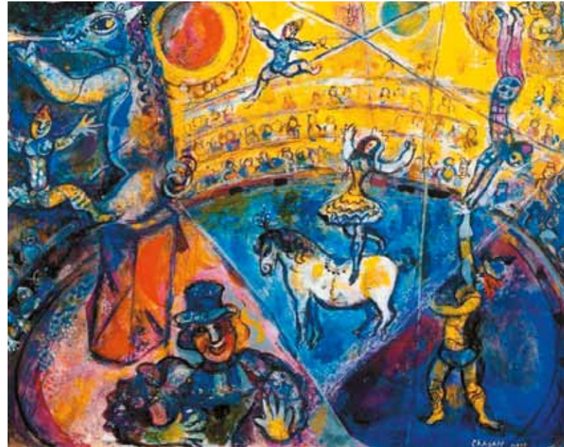
3. Marc Chagall: Cirkusz, 1964 magántulajdon

Lehetett volna egy László Fülöp-kaliberű, sikeres, gazdag és tehetséges portréfestő, ha saját maga és a történelem nem döntöttek volna másképp. Bolmányi Ferencet egész kiskorától csak a rajzolás és a festés érdekelt, tehetségére pedig korán felfigyeltek. Gimnazistaként állította ki először műveit a békéscsabai Munkácsy Mihály Múzeumban, és 16-17 évesen már számos portrémegrendelést kapott a környék prominens lakóitól. Egy rövid főiskolai kitérő után Bécsbe költözött, ahol hamar a felső tízezer kedvenc (udvari) festőjévé vált. Osztrák, olasz és magyar nyelvű újságok, divatlapok cikkeztek a fiatal, jóképű festőről, aki a megrendelők ízléséhez híven „gyártotta” a fél és egész alakos, reprezentatív arcképeket. Egy harmincas évek elején készült riportban Bolmányi elárulta, hogy festményei Amerikában ekkoriban akár tízezer dollárért is elkélhettek. Bolmányi kitanulta a szakma minden csínját-bínját, a kisujjában volt a technikai tudás, de tudta, ahhoz, hogy mesteremberből művésszé váljon, több kell. 1