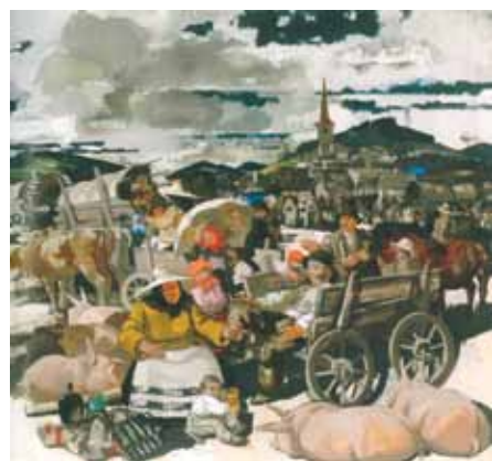
Aba-Novák Vilmos: Csíkszeredai piac, 1940 Magyar Nemzeti Bank

Aba-Novák Vilmos az 1930-as évek folyamán, a nagyobb szabású állami és egyházi freskómegbízások mellett készült népies életképei az életmű egyik legvonzóbb, legérdekesebb műtárgycsoportját alkotják. Az évtized folyamán készült sorozat első darabjai még Szolnokhoz kötődnek, majd az 1935-ös, Nagy Imréné az erdélyi Csíkszögödön tett látogatása eredményeként már reprezentatív kollekciót láthatott alkotásaiból a szakmai- és nagyközönség. Népeletképeiből rendeztek kiállítást a harmincas évek közepén a Fränkel Szalon termeiben, a tárlatot gazdagon illusztrált katalógus kísérte. A tempera technikával jó minőségű falemezre készített kompozíciókon a kőművesek, kubikusok mellett cséplők, pihenő mezei munkások és tiszai halászok jelentek meg. De hétköznapiak mellett a művész megörökítette vallásos életüket, a körmeneteket, valamint a vásárok színes forgatagát a körhintával, valamint a látványos paraszttáncot és a lacikonyhák kedélyes világát is.