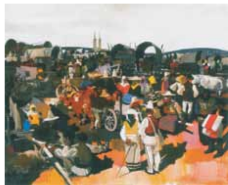
Aba-Novák Vilmos: Csíkszeredai vásár, 1935 Magyar Nemzeti Galéria