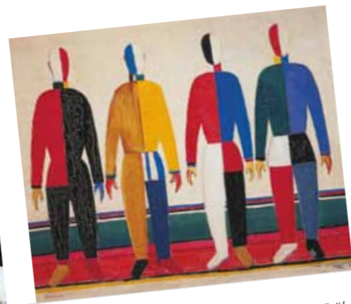
7. Kazimir Malevics: Sportemberek, 1928-32 körül Állami Orosz Múzeum, Szentpétervár