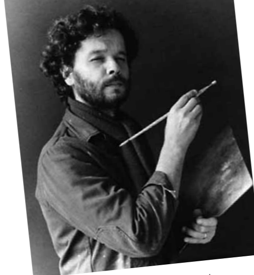
1. Birkás Ákos: Önarcépfestés kamerával (sorozat), 1977-78 magántulajdonban