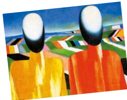
6. Kazimir Malevics: Földművesek, 1930 Állami Orosz Múzeum, Szentpétervár